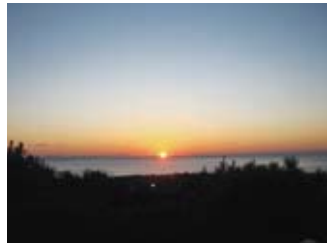
初日の出 "日立"の名の由来にもなった太平洋から真上に昇る美しい日の出