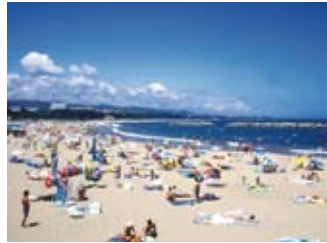
7~8月 海水浴 ホテルから車で20分の河原子海水浴場