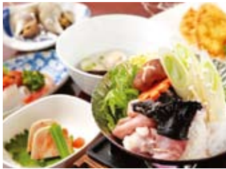
10月~3月 名物あんこう料理 毎年人気のあんこうコース(一例)