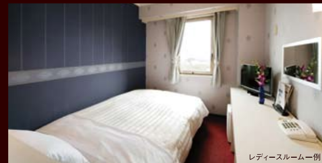
レディースルーム一例

ぬくもりのあるロビーきめ細やかなサービス機能でおしゃれなお部屋やすらぎとくつろぎの時間をお過ごしください。