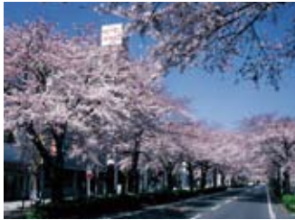
4月 さくらまつり ホテル前の平和通りにて

海と山に囲まれた歴史と文化、 大自然が息づくまち日立をゆっくり満喫してください。