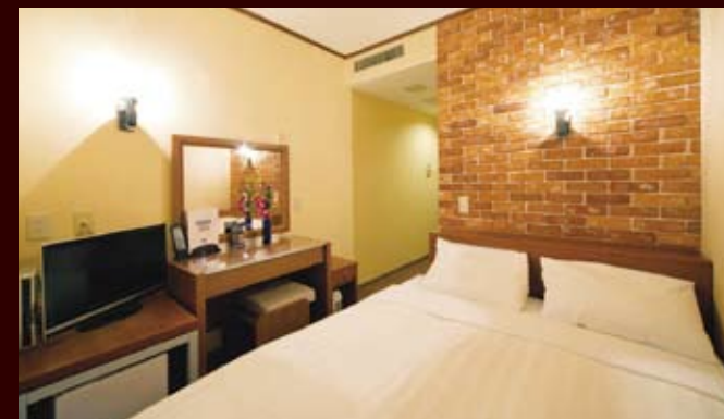
プチダブルルーム

Guest Room [お部屋タイプいろいろ] シングルからトリプルまで目的に合わせてお選びいただけます。 女性のためのレディースルームもご用意しております。