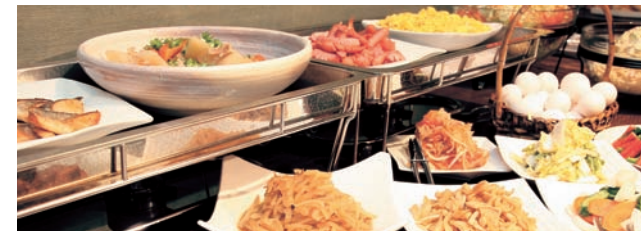
Viking 種類豊富な和洋バイキングをお楽しみください。