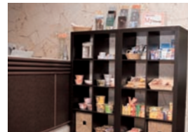
フロントコンビニ