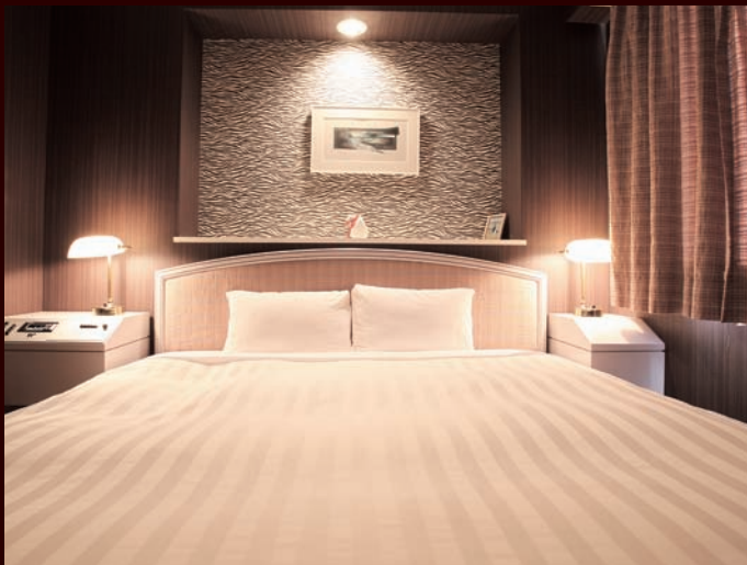
上質感に満ちた開放的な室内で疲れを癒す至福の時間をお楽しみください。