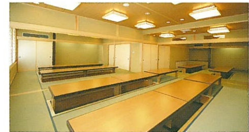
1F120名 (個室6室含) 2F宴会場:100名 多目的室50名

ホテル1階の「信州そば三城」では、伝統的信州蕎麦と本格的な日本料理がお楽しみいただけます。地酒、焼酎も豊富に取りそろえています。プライベートな時間を演出する個室に加え、ご会食・ご宴会のための和室大広間も用意しました。素材にこだわった旬の味わいをご堪能ください。また朝食や昼食にもお気軽にご利用いただけます。