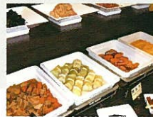
※ご朝食の参考写真です。