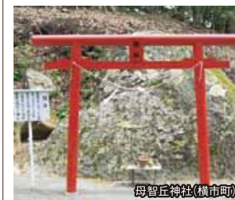
母智丘神社(横市町)

上質な落ち着いた雰囲気であつづきの時間を演出。 リラグゼーションルームにはCD・MD、DVDプレイヤーなどもご用意しております。