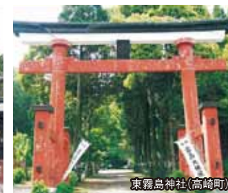
東霧島神社(高崎町)