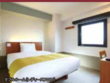
ダブルルーム(レディースフロア)