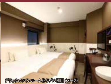
デラックスツインルーム(トリプ利用イメージ)