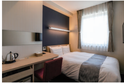
シングルルーム/セミダブルルーム

フランスベッド社との 共同開発ウィングオリジナルベッドが あなたの身体を包み込みます。