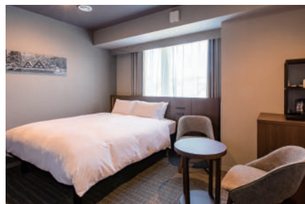
ユニバーサルクイーン