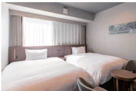
スーペリアツイン