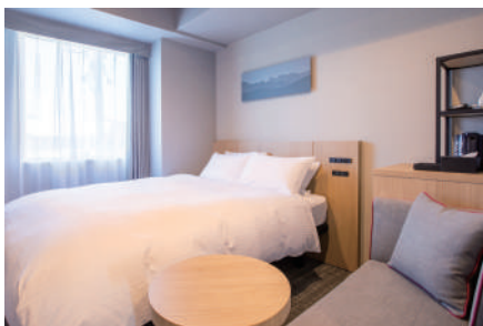
デラックスシングル/ダブル