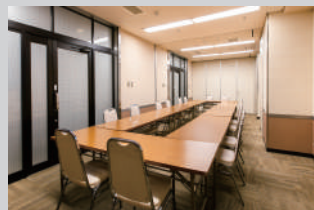
1階会議室①②③(22 ~ 61 m) 10名 ~ 32名