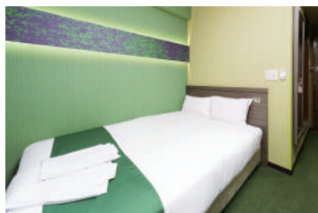
シングル/セミダブル