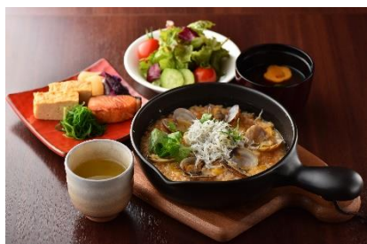
あさりとしらすの雑炊