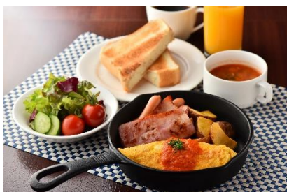
アメリカンブレイクファースト