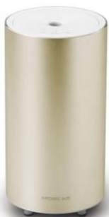
アロマディフューザー