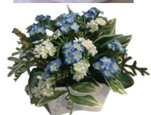
アーティシシャルフラワー