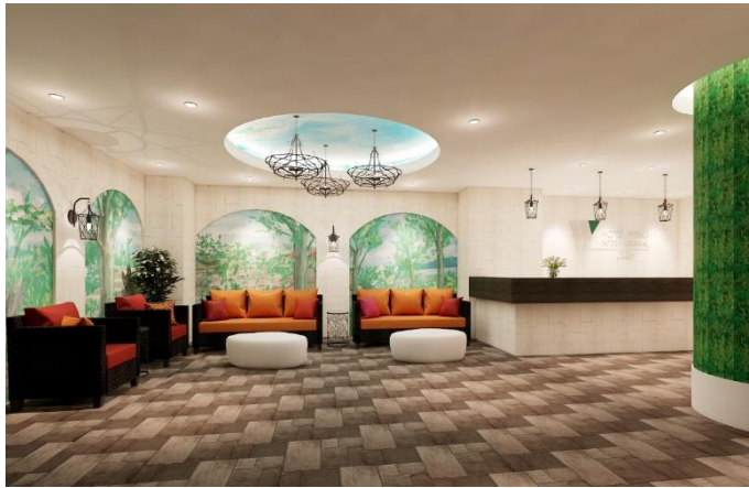
フロント・ロビーパス